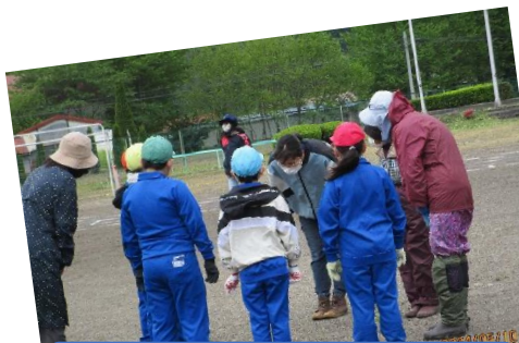
まずは挨拶をして

終了後も、地域の方々は校庭の川側の木の下を重点的に、きれいにしてくださいました。おかげで、運動会はすっきりしたところで開催することができました。改めて地域の方々へ感謝いたしました。学校、そして子ども達のことを常に考え、尽力して下さっている皆さん、本当にありがとうございます。