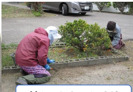
植えこみまでスッキリ