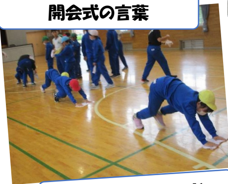
後片付けもスッキリと