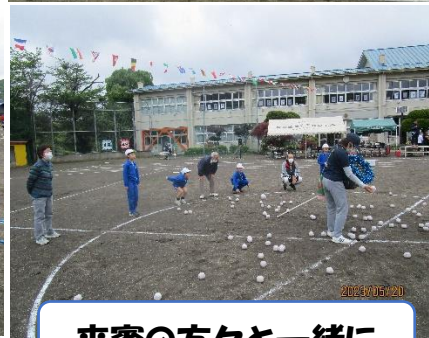
来賓の方々と一緒に