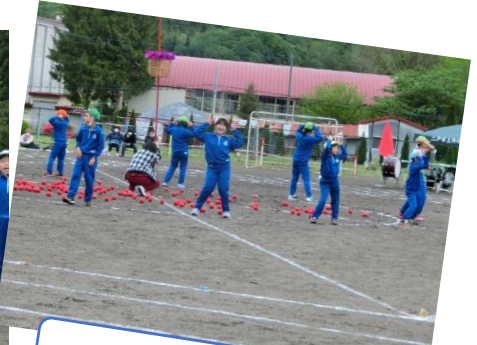
踊ったい、玉入れたい