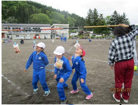
パン食いは はずせません