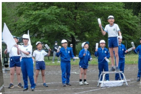
応援 がんばります！