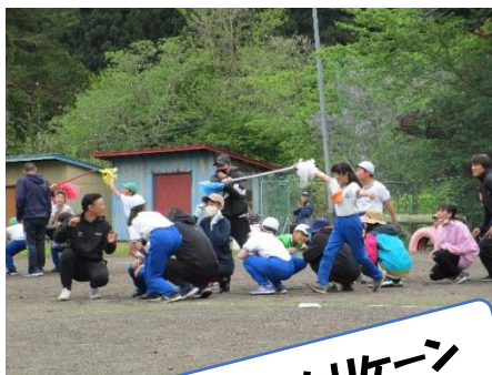
高学年：親子でハリケン

親子競技は、何よりも家族の思い出に残るレースです。親と一緒に活動する時こそ、子ども達は、最高の表情を見せてくれるからです。保護者の皆さんも素敵な表情でした。お家の方々も、ほんのちょっとだけですが、運動不足解消になったのではないのでしょうか。