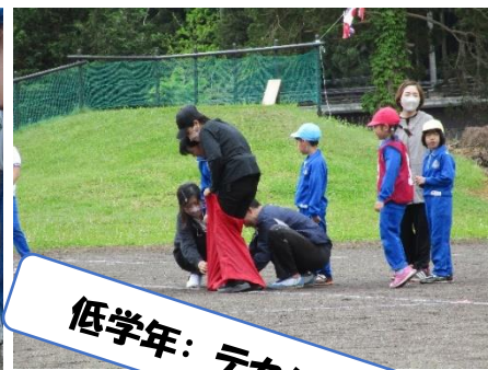
低学年：テカパンレース