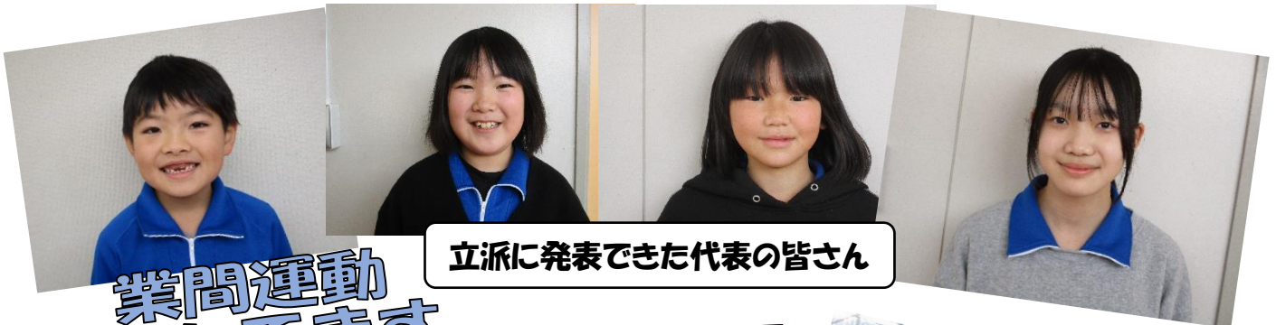
立派に発表できた代表の皆さん

2学期間、子ども達は朝ごはんをしっかりと食べ、明るい気持ちで登校できました。宿題を忘れずに取り組むことができました。夜遅く起きている子もほとんどおらず、睡眠時間も確保でき毎日生き生きと生活できました。このような日々の営みが、当たり前のようにできたことはすべて保護者の皆様の支えのおかげです。本当にありがとうございました。そして、25人の子ども達が、大きな病気や怪我にもあわず、健康に過ごすことができたことを共に喜び合いたいと思います。